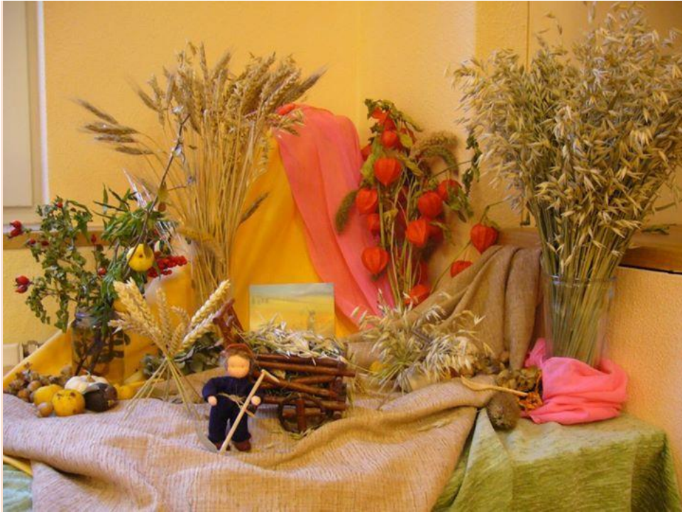
Voorbeeld KDV seizoenstafel