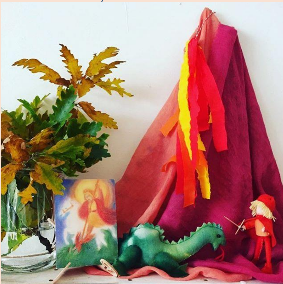
Voorbeeld BSO seizoenstafel